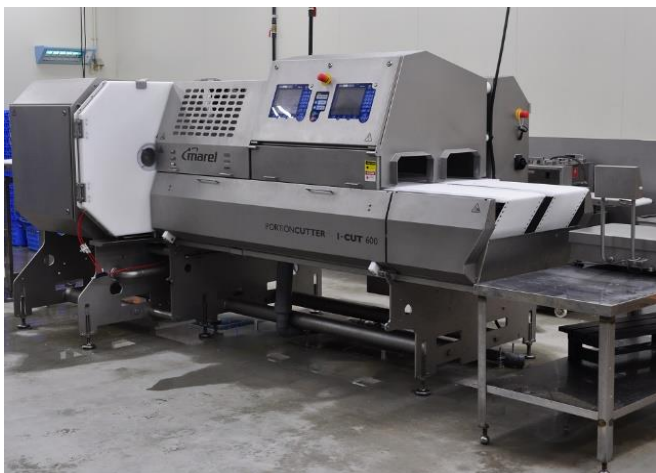
オートポーションカッター