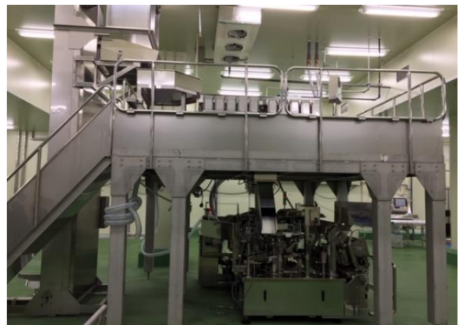
自動計量・真空機